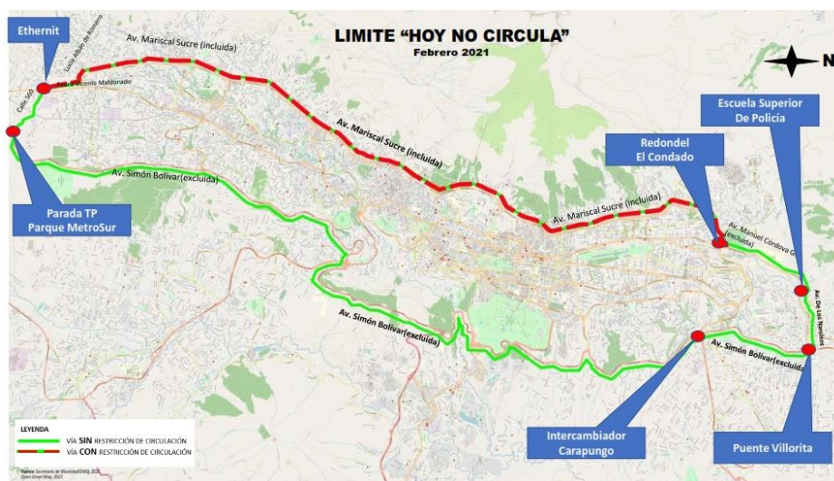
Figura Nro. 1: Límites del plan de restricción y regulación vehicular "Hoy no Circula"